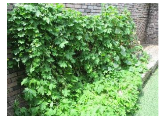
ゴーヤとキュウリの緑のカーテン

菜園の様子をご紹介します。今年は夏野菜に加え新たにメロンやスイカに挑戦し、立派に成長しました。カットして利用者さんのおやつ時間に提供し楽しんでいただきました。