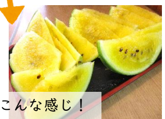
切ってみるとこんな感じ！

菜園の様子をご紹介します。今年は夏野菜に加え新たにメロンやスイカに挑戦し、立派に成長しました。カットして利用者さんのおやつ時間に提供し楽しんでいただきました。